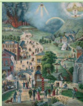
Bild: "Der breite und der schmale Weg"